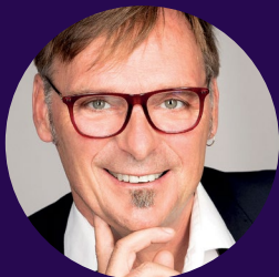
Erwin Eggenreich Bürgermeister